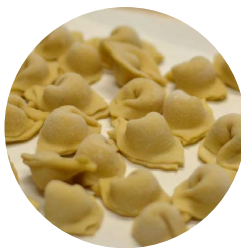
Cappelletti solo formaggio