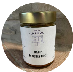
Ragù di carne