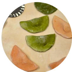
Mezzelune ai formaggi