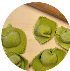
Cappellacci ai formaggi