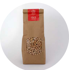
Ceci Biologici Sacchetto 500 gr.