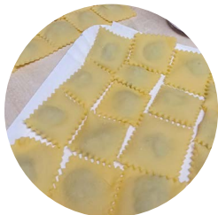
Tortelli alle erbe