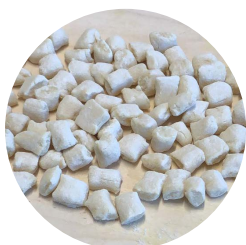
Gnocchi con patate