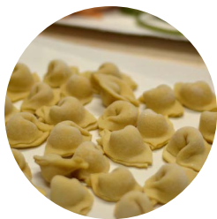
Cappelletti di carne