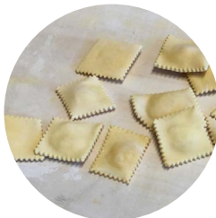
Tortelli zucca e patate